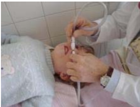
Lavage de sinus