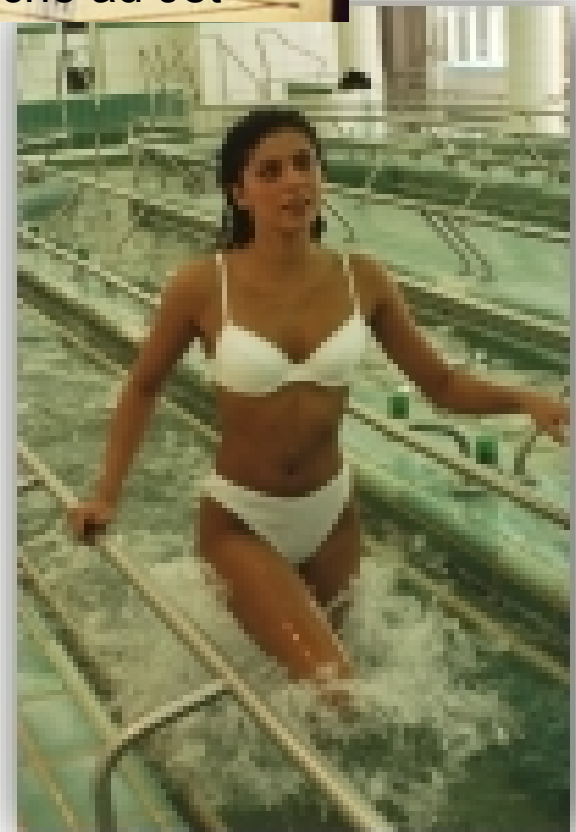
Couloir de marche