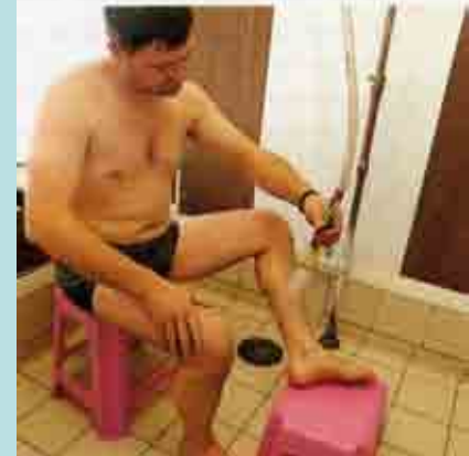
Douche arthéritique Bain les Bains