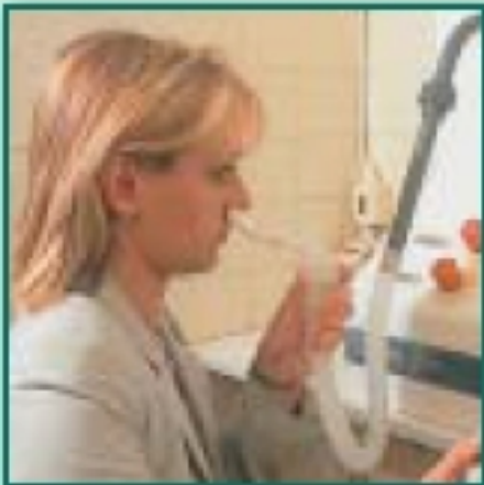
5 - Aérosol mano-sonique