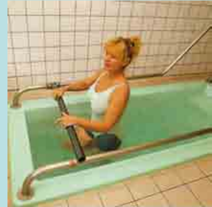
Couloir de marche